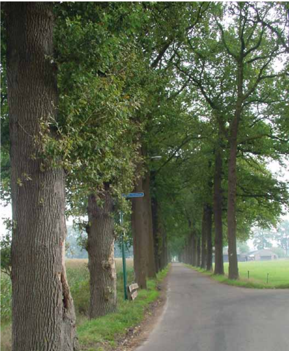
In het buitengebied staan duizenden joekels van bomen, waaronder prachtige eiken van 50 tot 80 jaar oud. Brands: 'Een private overeenkomst waarin je de rekenmethode NVTB vastlegt, voorkomt een gang naar de rechter: als er schade aan bomen ontstaat tijdens het grondroeren, moeten deze volgens de rekenmethode van de NVTB-methode worden vastgesteld en direct door de grondroerder worden betaald.'

mis te gaan, hebben we een bestuurlijk mandaat om het werk direct stil te leggen. De aannemer moet dan maatregelen nemen voordat hij verder mag werken. Als hij dat niet doet, kost hem dat alleen maar geld.'